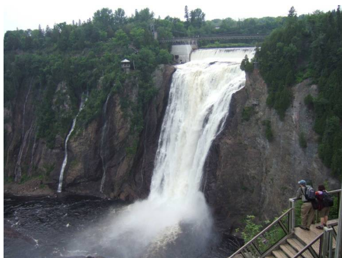
モンモラシーの滝 2015.7.7