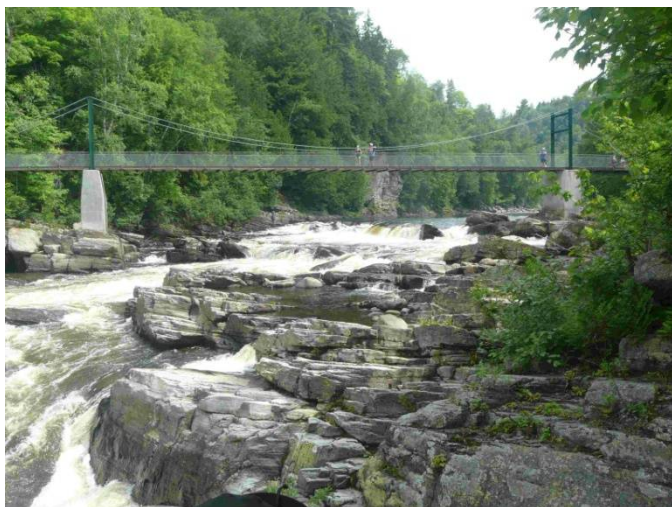
サントヌヌ溪谷ハイキング 2015.7.7