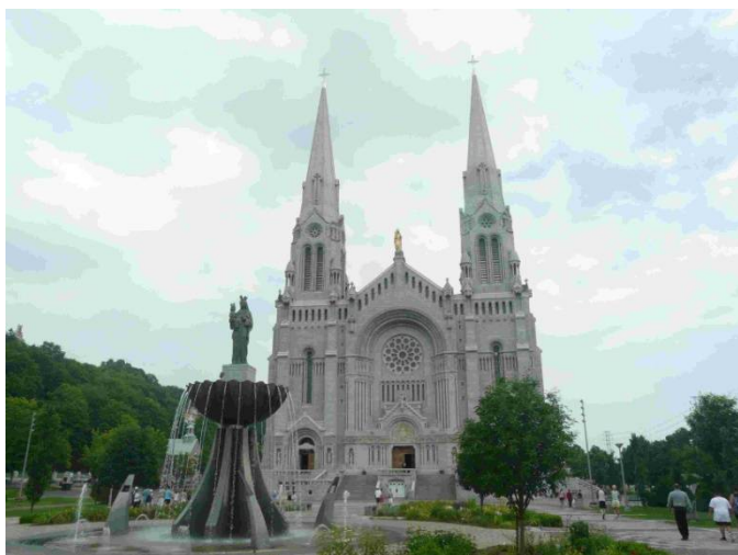
サントヌヌ・ド・ボープレ大聖堂 2015.7.7