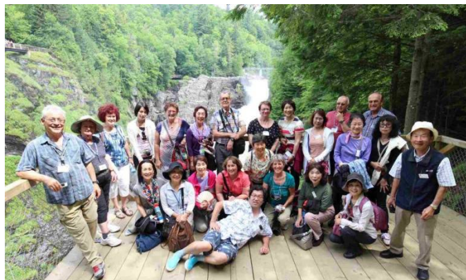
サントヌヌ溪谷集合写真 2015.7.7