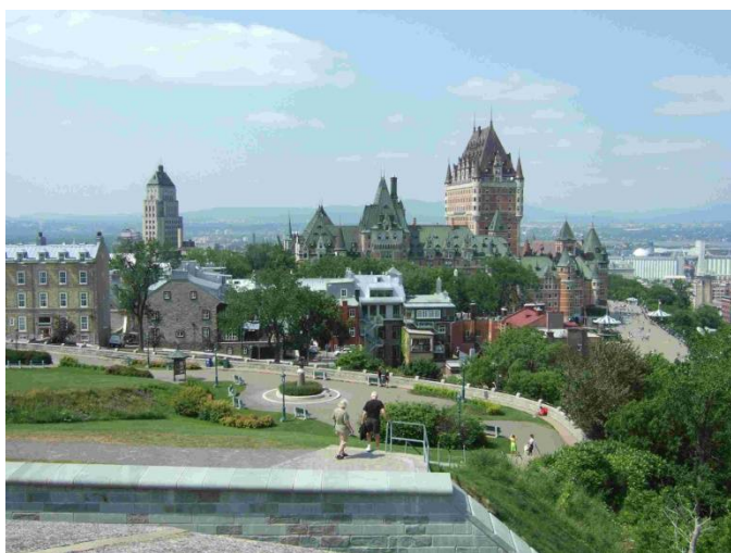
ケベックシティ中心部 2015.7.6